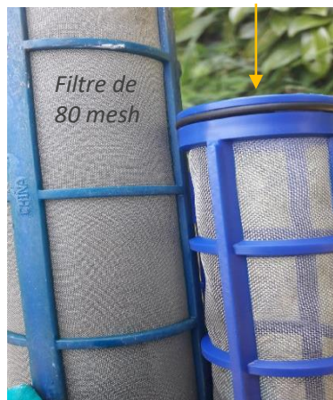
Filtre de 50 mesh

Les photos ci-dessous vous permettent de comparer différents filtres pour avoir une première idée visuellement :